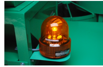
ブザー音でお知らせしながら点灯 (ピーピー音)