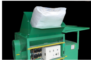
材料を袋から出して投入